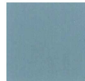
606 - OVAL ROOM BLUE 85 FB