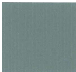
608 - CARD ROOM GREEN FB