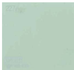
601 - VERT TÉLÉMARK

Dans le village et hameaux anciens, en cas de changement, les fenêtres et les contrevents seront changés à l'identique de l'origine en bois peint. La teinte sera harmonisée. Une seule teinte de persiennes sera mise en œuvre par façade, ainsi que pour les fenêtres et portes fenêtres. Les teintes pourront être employées également pour les ferronneries et certaines portes d'entrée.