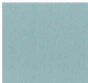
604 - CHAPPELL GREEN 83 FB