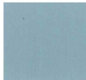
605 - DIX BLUE 82 FB